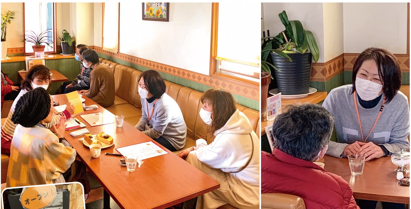
オレンジカフェだいたい 喫茶店「カルダン」での活動の様子 (内容は4ページ)