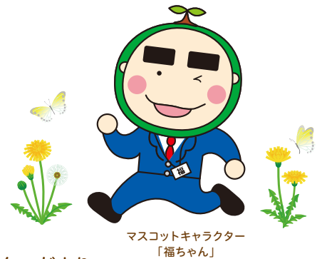
マスコットキャラクター 「福ちゃん」