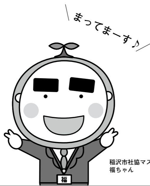
稲沢市社協マスコットキャラクター 福ちゃん